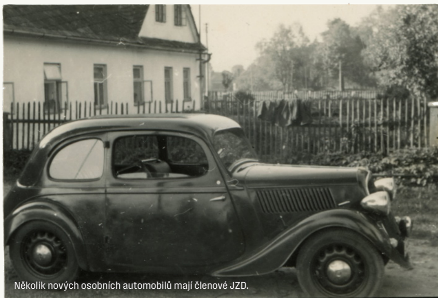
Několik nových osobních automobilů mají členové JZD.

Protože elektrická síť po vsi je značně sešlá a je příčinou častých poruch, domáhá se MNV obnovy této sítě. V tomto roce počaly Elektrovodné závody Pardubice stavbu sítě nové. Jednotlivé úseky obce jsou na kratší dobu vyřazeny z odběru proudu a po provedení sítě nově opět