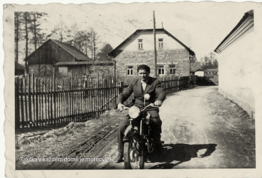
Takřka v každém domě je motocykl.

Jako každoročně zúčastňují se občané a školní mládež oslav v Lanškrouně. Vesnice čistě uklizená je vyzdobena vlajkami a příležitostnými nápisy a plakáty. Večer koná se slavnostní představení v kině.