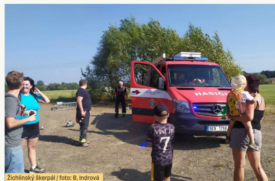
Žichlínský škerpál