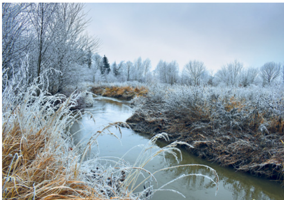
Na poldru 1. ledna 2021