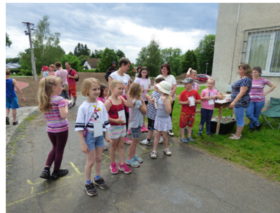
Foto pořízené při této akci naleznete na www.zonerama.com/BlankaIndrova

Těšit se budu na setkání na dalším Dětském dnu. Blanka Indrová