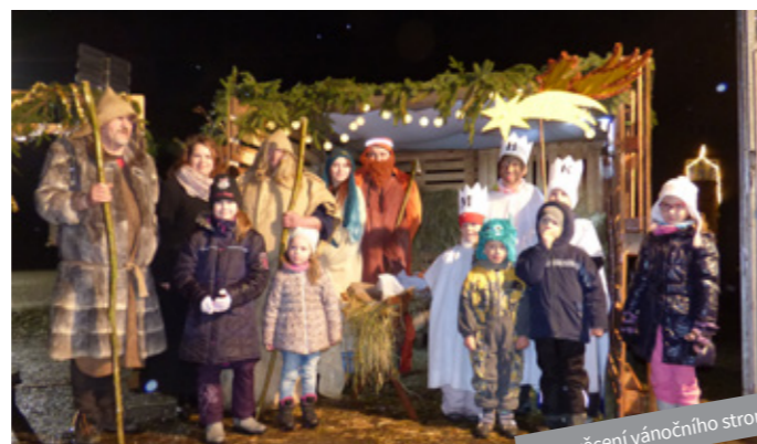
Rozsvícení vánočního stroměčku