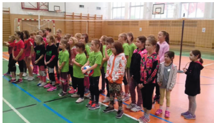
Kvalifikační turnaj Krajského přeboru přehazované dívek 19. 11. 2017 v Poličce