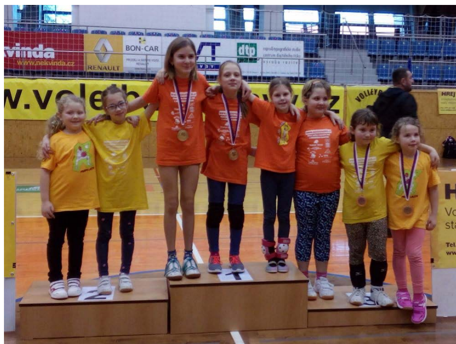
Úspěšný turnaj Barevného minivolejbalu 28. 1. 2018 ve Svitavách. Hráčky bez medaile se úspěchu dočkaly na jiném turnaji.