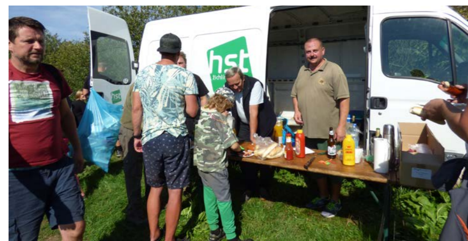
Občerstvení u Kozího rybníka

Když se v roce 2010 konal nultý ročník za účasti cca 20 lidí, určitě by se tehdy pár nadšenců - pořadatelů nenadalo, že za 8 let se přiblíží počet účastníků stovce.