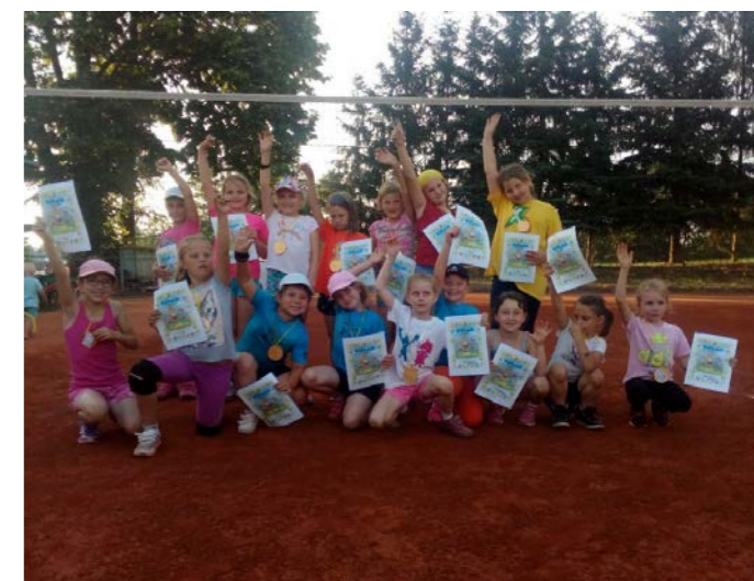
Rodičovský turnaj 8. 6. v Žichlínsku. Diplom a čokoládovou medaili si zasloužili všichni.