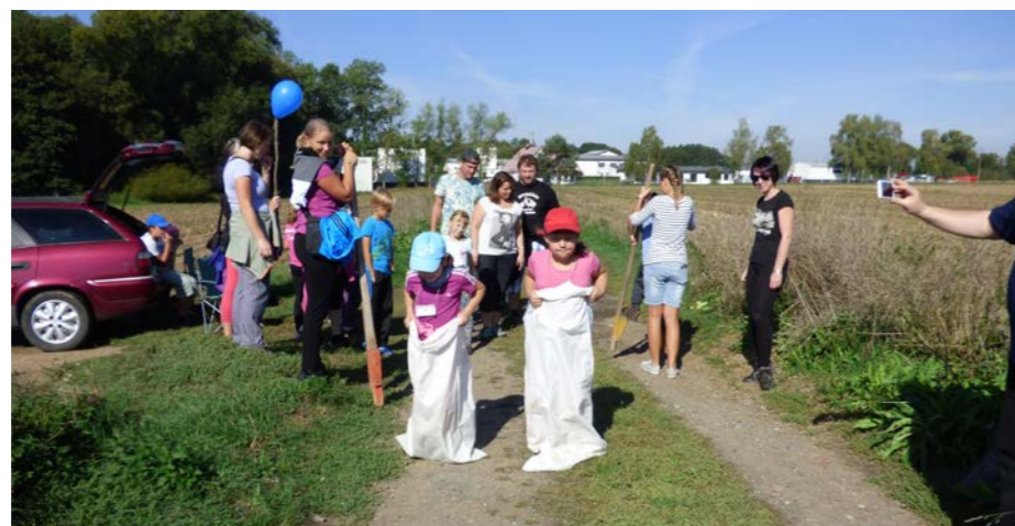
Pro děti byly připravené různé disciplíny

Devadesát tři účastníků si udělalo příjemné dopoledne procházkou dlouhou 8,8 km ke Kozímu rybníku. Krásného počasí si užili všichni, od nejmenších v kočárcích až po seniory. Účastníci po trase plnili různé soutěže a úkoly. U Kozího rybníka si opekli špekáčky a občerstvili se. Ukázalo se, že i nedělní dopoledne je „dobrý termín“.