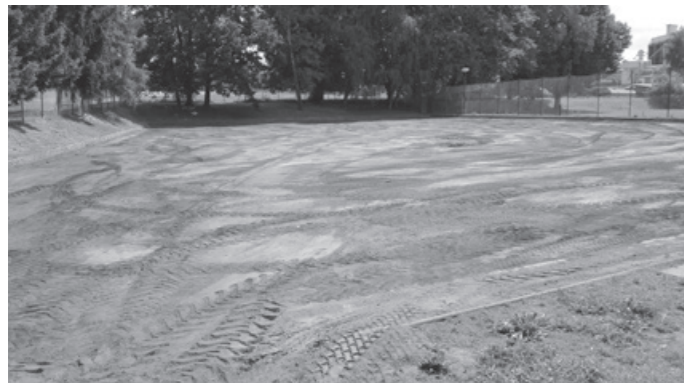
skrývka stávajícího povrchu