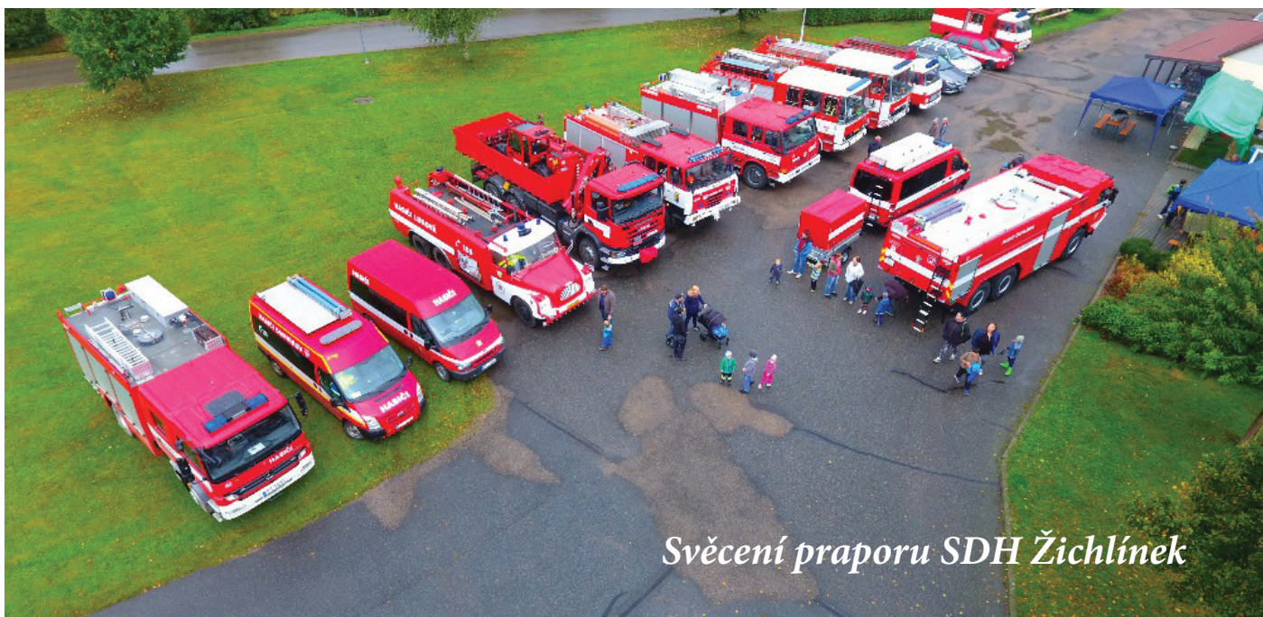
Svěcení praporu SDH Žichlínek