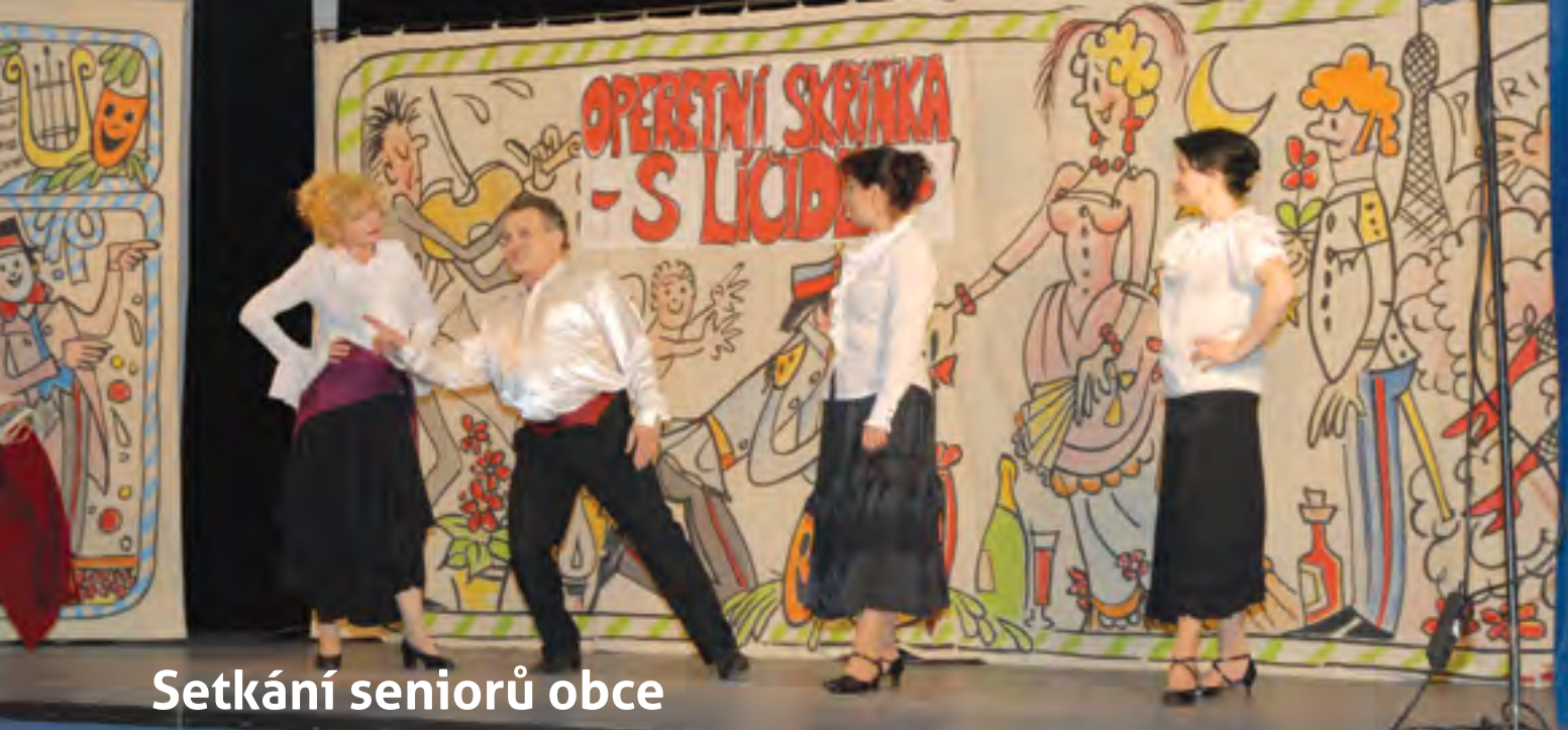
Setkání seniorů obce