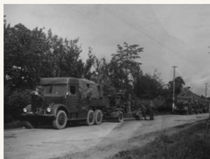
Vozidla používaná povstalci, odstavená za obcí Kelemeš (dnes tvořící součást Prešova).

Nastaly dny nepředstavitelné hrůzy, nikdo si nebyl jist životem. Organisač-