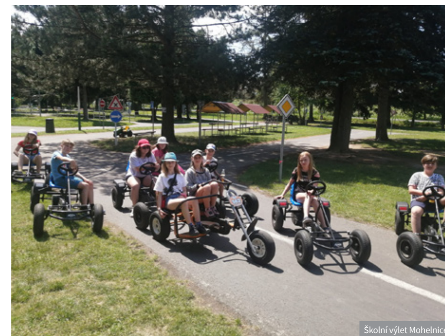
Školní výlet Mohelnice