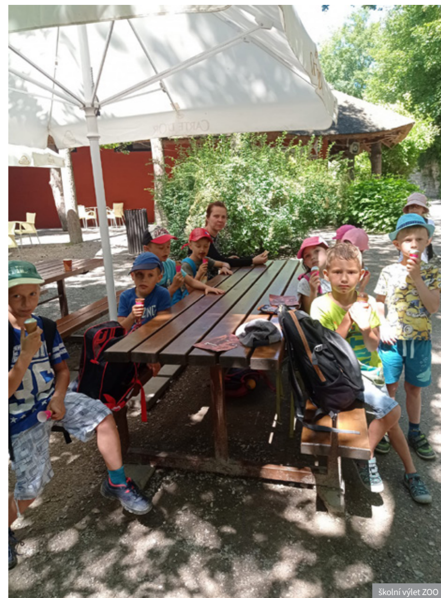
školní výlet ZOO