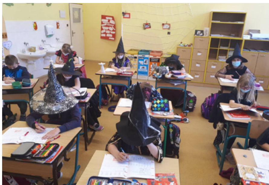
Čarodějnice ve třídě