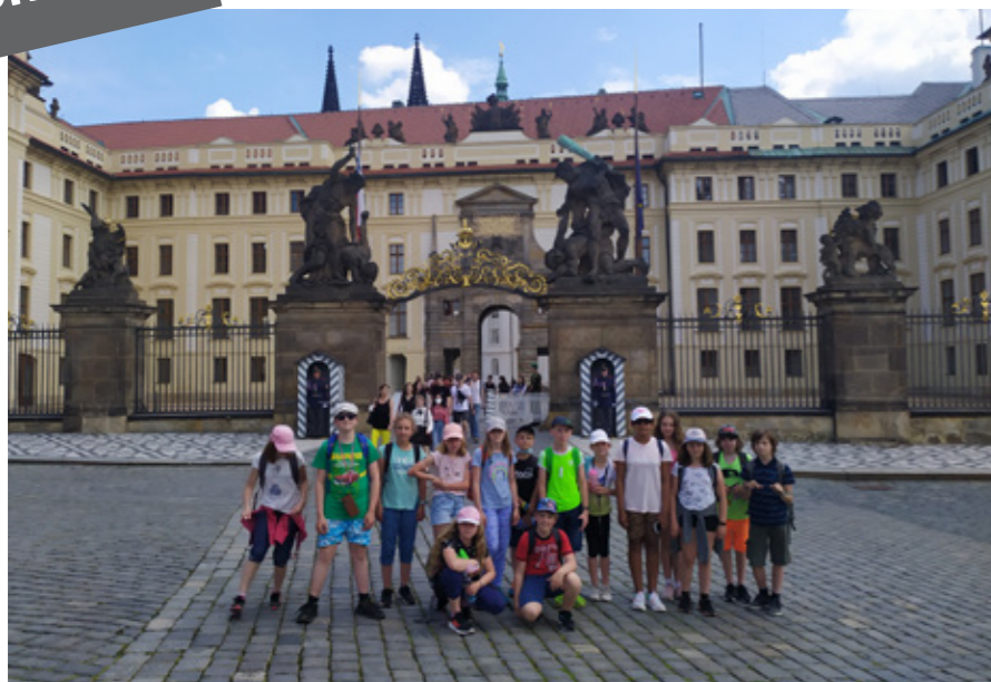
Výlet do Prahy