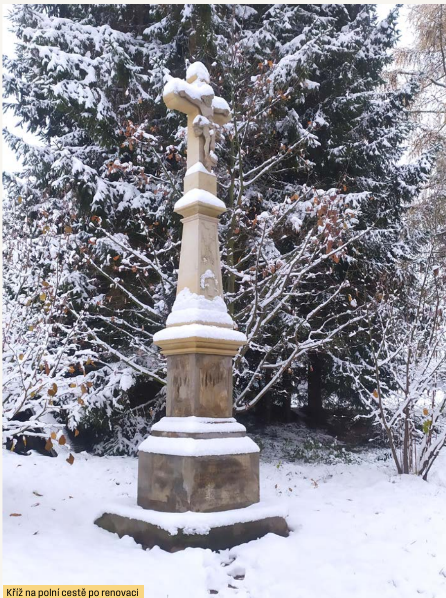
Kříž na polní cestě po renovaci

I nadále budeme směřovat své úsilí k rozvoji kulturně společenského života obce, který chápeme jako nepostradatelnou a velmi důležitou součást života v naší obci. Touto cestou děkuji spolkům působícím v naší obci za odvedenou práci a úsilí, které věnují své činnosti zejména ve svém osobním čase, a přispí-