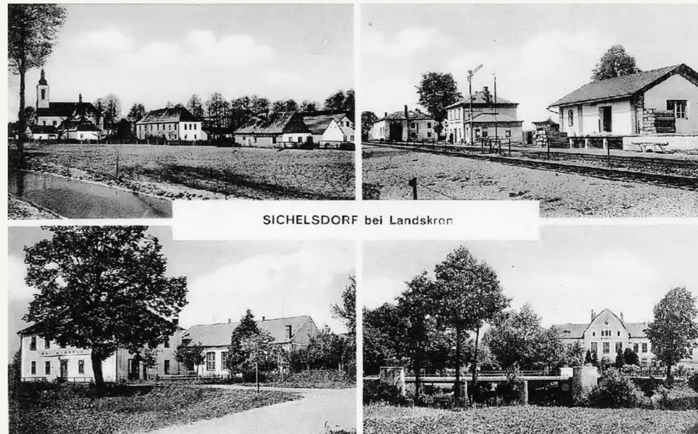
SICHELSDORF bei Landskron

ho povolení předpokládáme v lednu/únoru 2024. V tuto chvíli bylo osloveno několik realizačních firem s žádostí o nacenění jednotlivých částí stavby.